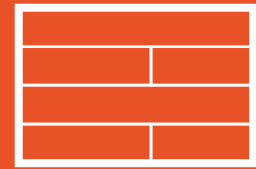
piso flotante fotolaminado en dormitorios