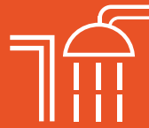
Shower Door, Termo eléctrico individual