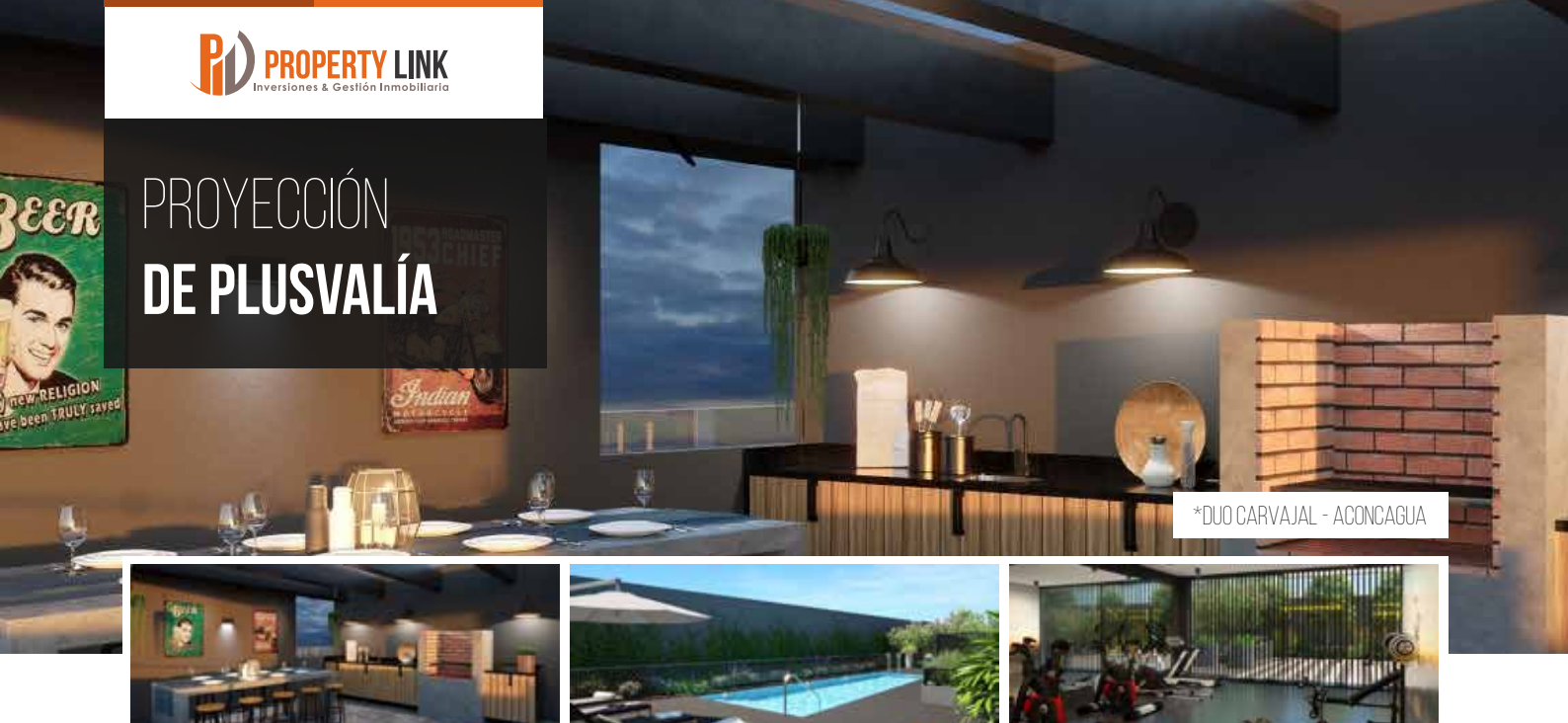
*DUO CARVAJAL - ACONCAGUA

Bodega e-commerce • Gimnasio techado con zona de ejercicios exterior Piscina • Área de juegos infantiles • 4 quinchos panorámicos • Sala multiuso Sala co-work • Área de reciclaje